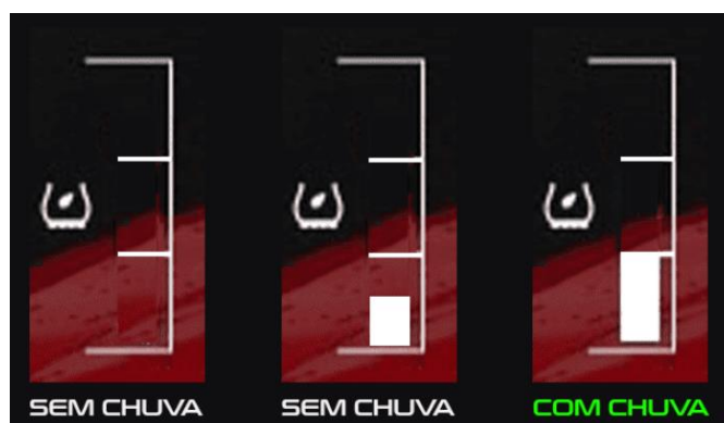
Figura 2 - Diagrama que exemplifica o momento em que é considerada corrida com chuva.

I. Considera-se corrida com chuva, caso a condição de água na pista encoste na marca de 1/3 (um terço) do marcador do jogo. Exemplo na Figura 2: